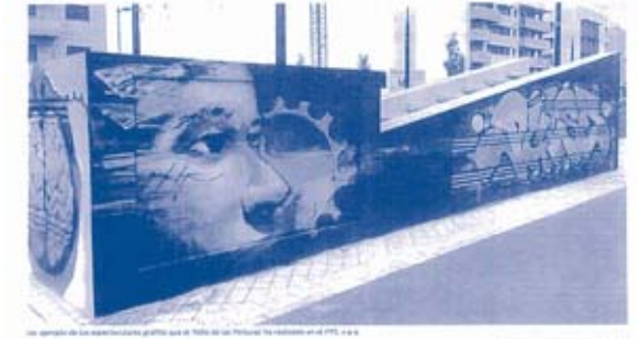
El Niño de las Pinturas deja su sello en el PTS

Cultura • El Niño de las Pinturas deja su sello en el PTS