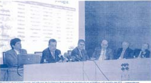
Momento de la presentación del informe de la Cámara de Cuentas de Andalucía en el edificio de la sede de la Cámara de Cuentas de Andalucía.

Las empresas consideran muy atractivo instalarse en la tecnología, que colabora muy estrechamente con la Universidad de Granada