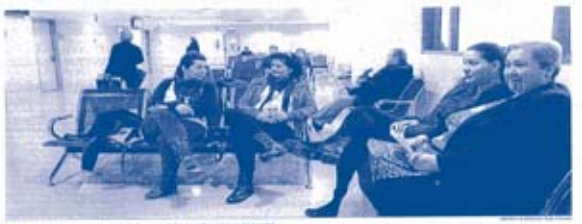
El centro inicia la primera fase de apertura...