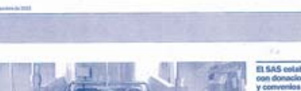
El centro inicia la primera fase de apertura...