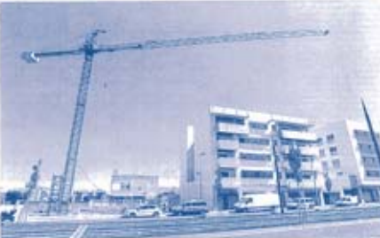
El distrito de San Andrés...